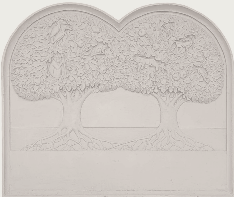
A Cseszkó-házaspár emlékére készülő dombormű agyagmintája

HÁLAADÓ ISTENTISZTELET ÉS DOMBORMŰAVATÁS 2025. JÚNIUS 15. SZENTHÁROMSÁG VASÁRNAPJA 9:30 ÓRA REFORMÁTUS ÓTEPLOM